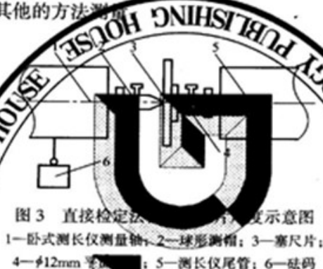
图3 直接测定法示意图

采用卧式测长仪直接测量(见图3)。在保证测量结果不确定度满足1/3塞尺厚度极限偏差的情况下,可用其他的方法测量。